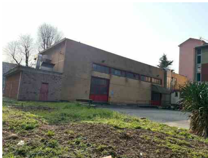
La sala Nalli di via Negarville

Ristrutturazione a carico del terzo settore per trasformare l'immobile in hub sociale del quartiere