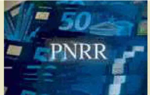
Stanziati fondi PNRR per gli asili nido