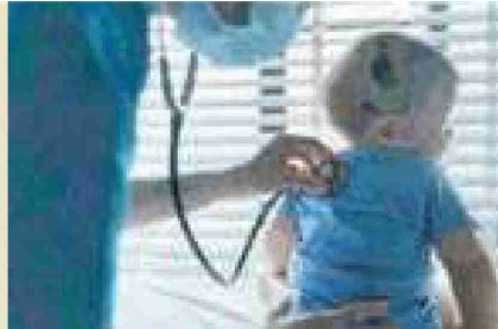
Numero di pediatri sufficiente