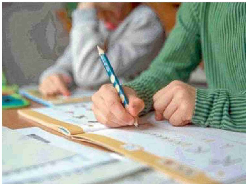
Preoccupa il dato della povertà educativa

L'85° posto su 107 significa che ci sono 84 province italiane in cui un bambino nasce con più opportunità di quello che nasce a Foggia