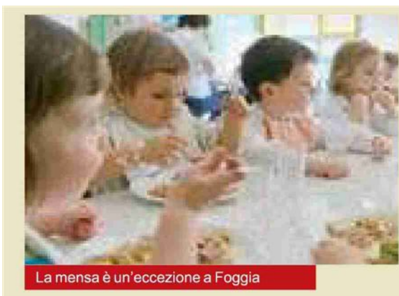
La mensa è un'eccezione a Foggia