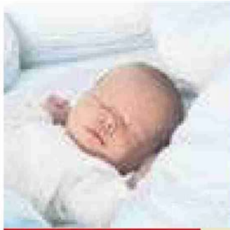
ra la media pugliese