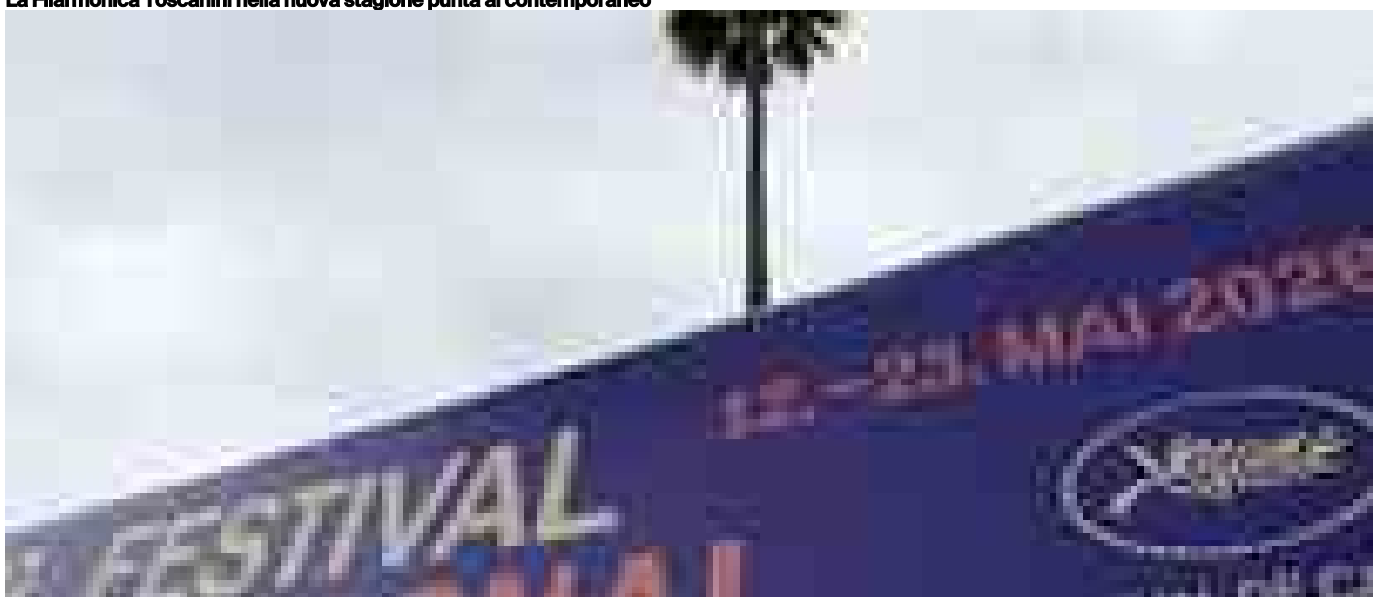
Cannes line up, le 10 cose da sapere del festival 2026