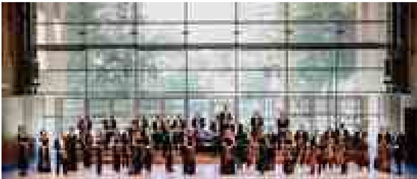
La Filarmonica Toscanini nella nuova stagione punta al contemporaneo