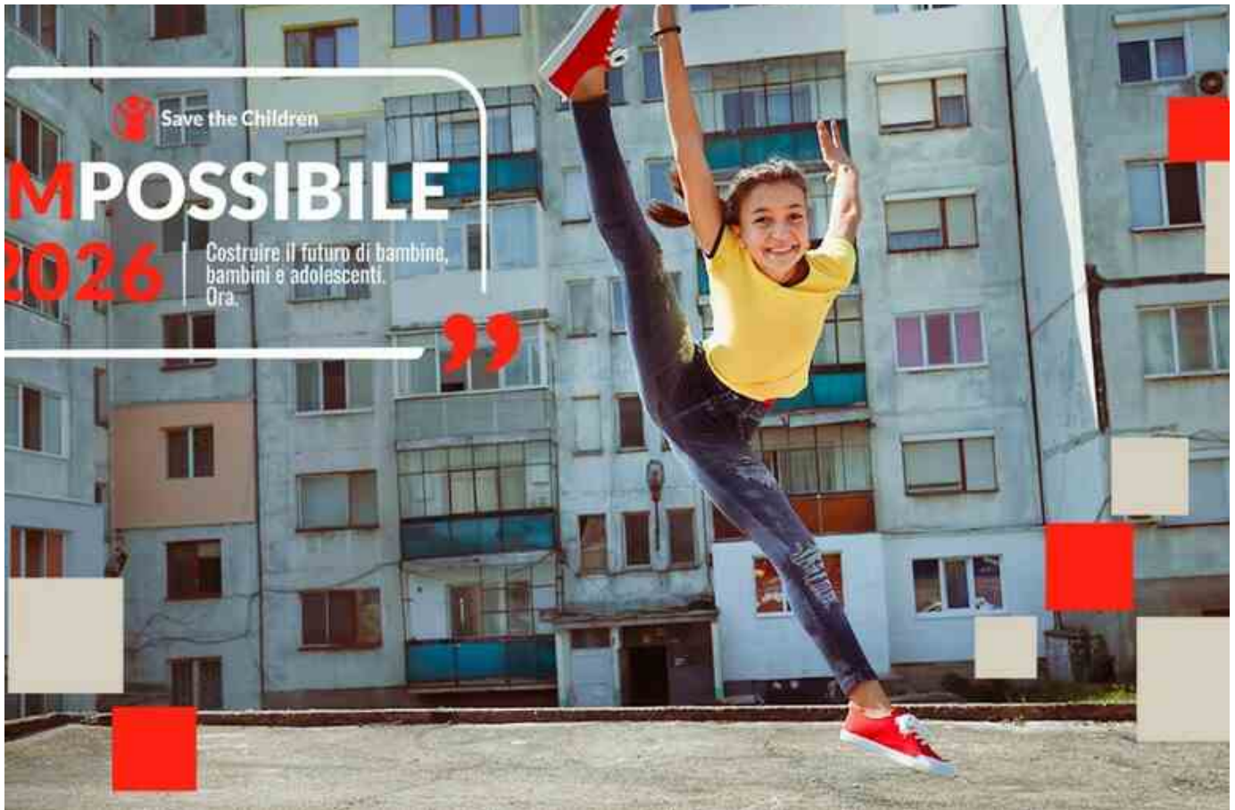
↑ La locandina di Impossible - RIPRODUZIONE RISERVATA

Il 21 maggio torna IMPOSSIBILE 2026 , la biennale promossa da Save the Children per i diritti dell'infanzia e dell'adolescenza.