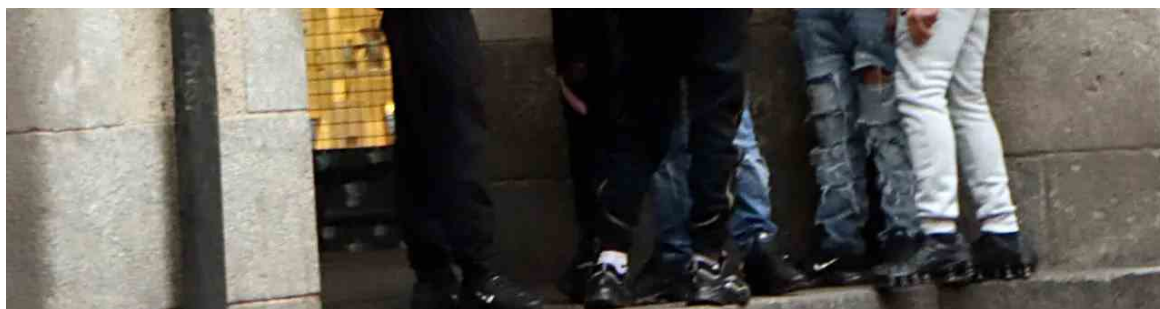
Rissa tra due gruppi di Maranza in piazza Mercanti

Entrando nel capitolo istruzione , sempre dai dati OpenPolis emerge che nel comune di Milano gli abbandoni precoci della scuola riguardano il 12,4% dei giovani tra 18 e 24 anni. E, tra i figli delle persone senza diploma , il dato sale al 19,3% a livello comunale. Complessivamente, la quota raggiunge il 28,2% nel nucleo di identità locale di Triulzo Superiore e risulta molto più contenuta nella zona delle Tre Torri (3,8%). Un altro dato che può servire a inquadrare il problema è quello dei "Neet" , ragazzi che non studiano né lavorano : sono il 20,4% a Milano con forti differenze territoriali .