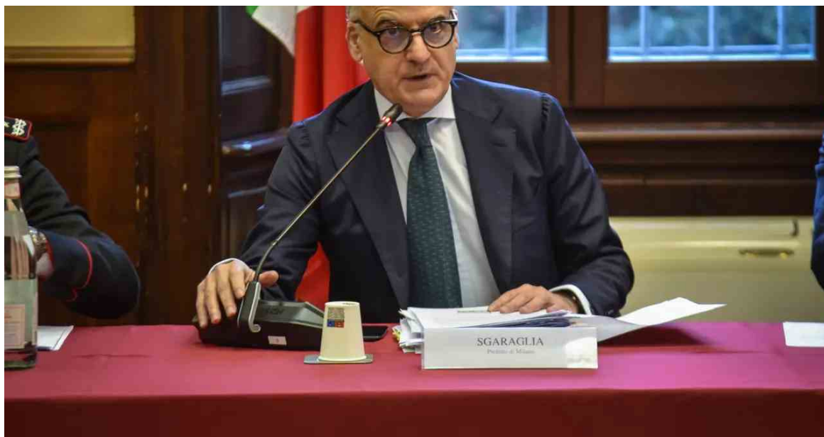
Claudio Sgaraglia, prefetto di Milano

L'ultimo capitolo è connesso all'uso delle lame e agli episodi di microcriminalità , che sono in calo all'ombra della Madonnina (circa 2.200 minorenni sono stati coinvolti in reati nel 2025, con una diminuzione del 6%), ma evidenziano un tema: tra i reati predatori, uno su cinque è commesso da under 18 . "C'è una grande presenza di attività delittuosa svolta da minori con uso dei coltelli – aveva spiegato anche il prefetto Claudio Sgaraglia nel bilancio di fine 2025 -. È necessaria non soltanto una repressione delle forze di polizia, ma un'attività molto più complessa che coinvolga anche le attività sociali, le scuole, le famiglie".