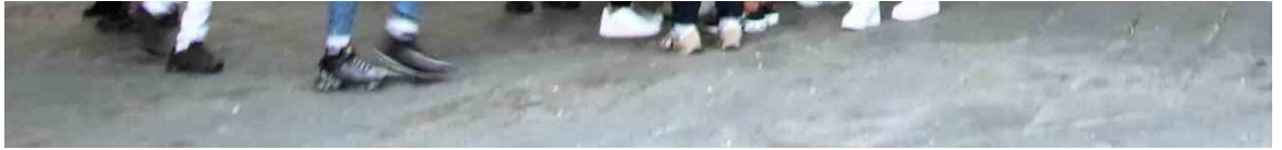
Baby gang a Milano