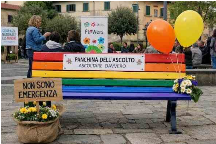
La panchina dell'ascolto

DI DOMITIA DI CROCCO DEL 7 APRILE 2026 ALLE ORE 16:54