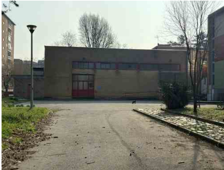
La sala Nalli di via Negarville

Prevista la riqualificazione degli spazi di via Candiolo 79 e della Sala Nalli di via Negarville