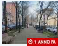
Scuola e formazione Corso Regio parco più green: per i bambini della Lessona panchine più resistenti in plastica riciclata