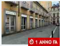
Cronaca Ancora una spaccata a colpi di tombino: nel mirino il Carrefour vicino a Porta Palazzo