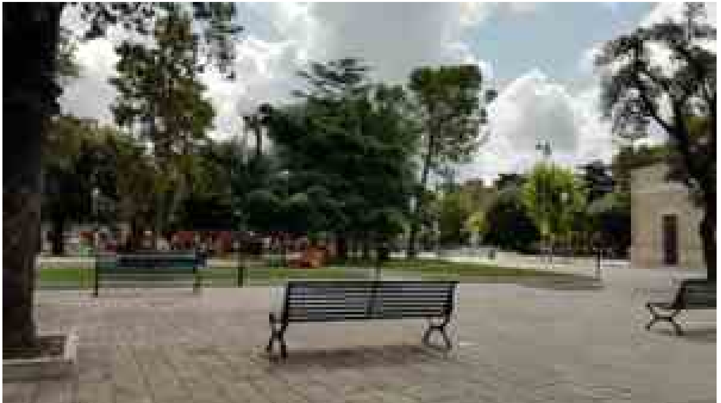
La villa Comunale di Mesagne

M ESAGNE – Domenica 15 febbraio 2026 dalle ore 10.30 alle 12 in Villa Comunale sarà promosso il percorso di prevenzione e benessere pediatrico, ideato nell'ambito delle attività del Centro Servizi per la Prima infanzia "Un, Tre, Sei...Casa!" attivo a Mesagne negli spazi della Scuola primaria Giosuè Carducci.