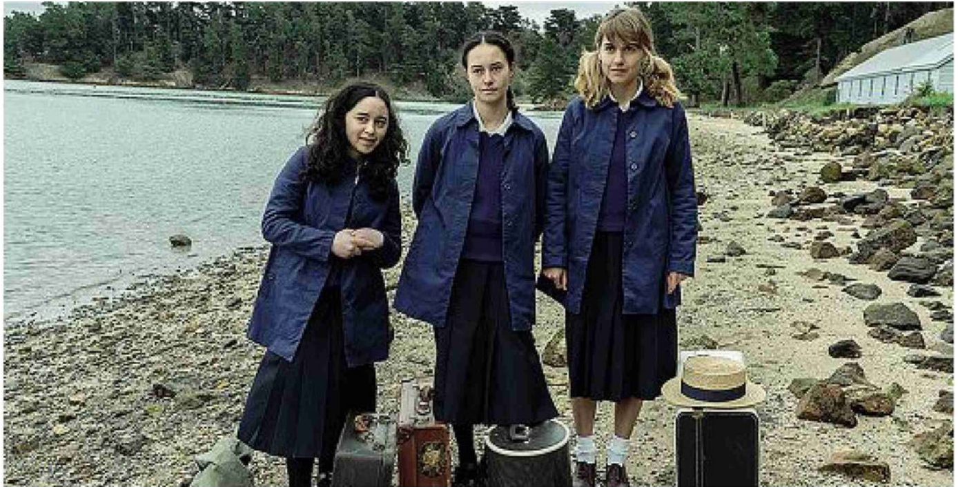
Dalla Nuova Zelanda Una scena di We Were Dangerous della regista Josephine Stewart-Te Whiu che sarà proiettato al Nuovo Sacher

Il cinema indipendente protagonista di tre rassegne: Lo Spiraglio , il festival dedicato al tema della salute mentale che si apre oggi al Maxxi; Immaginaria. International Film Festival of Lesbians & Other Rebellious Women da domani al Nuovo Sacher; «Il regista a due teste. Il cinema dei fratelli Coen», al Palazzo Esposizioni da domani. a pagina 13 Ulivi