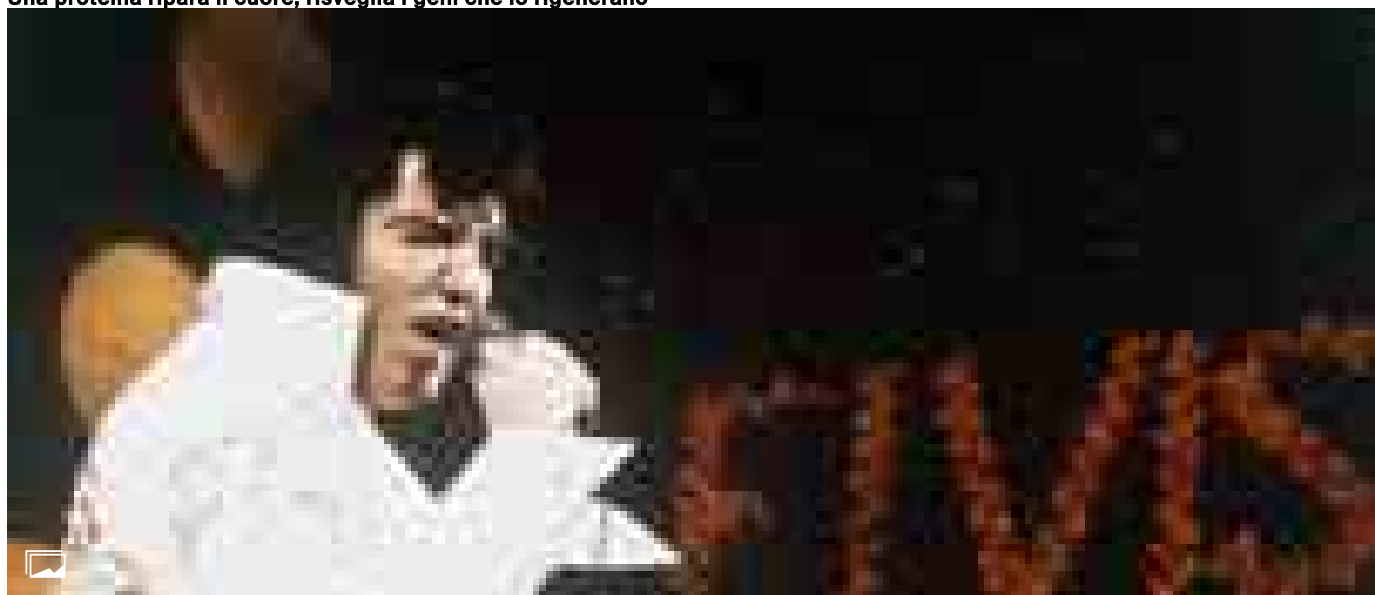
Elvis Presley, avrebbe compiuto 90 anni Il re del Rock' n' roll