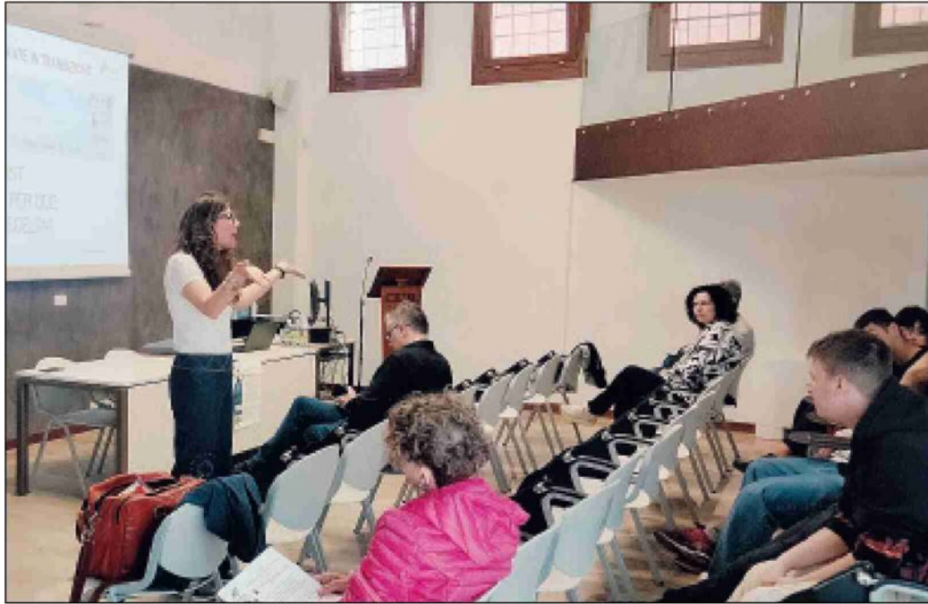
Alcuni momenti della giornata di orientamento a palazzo Angeli