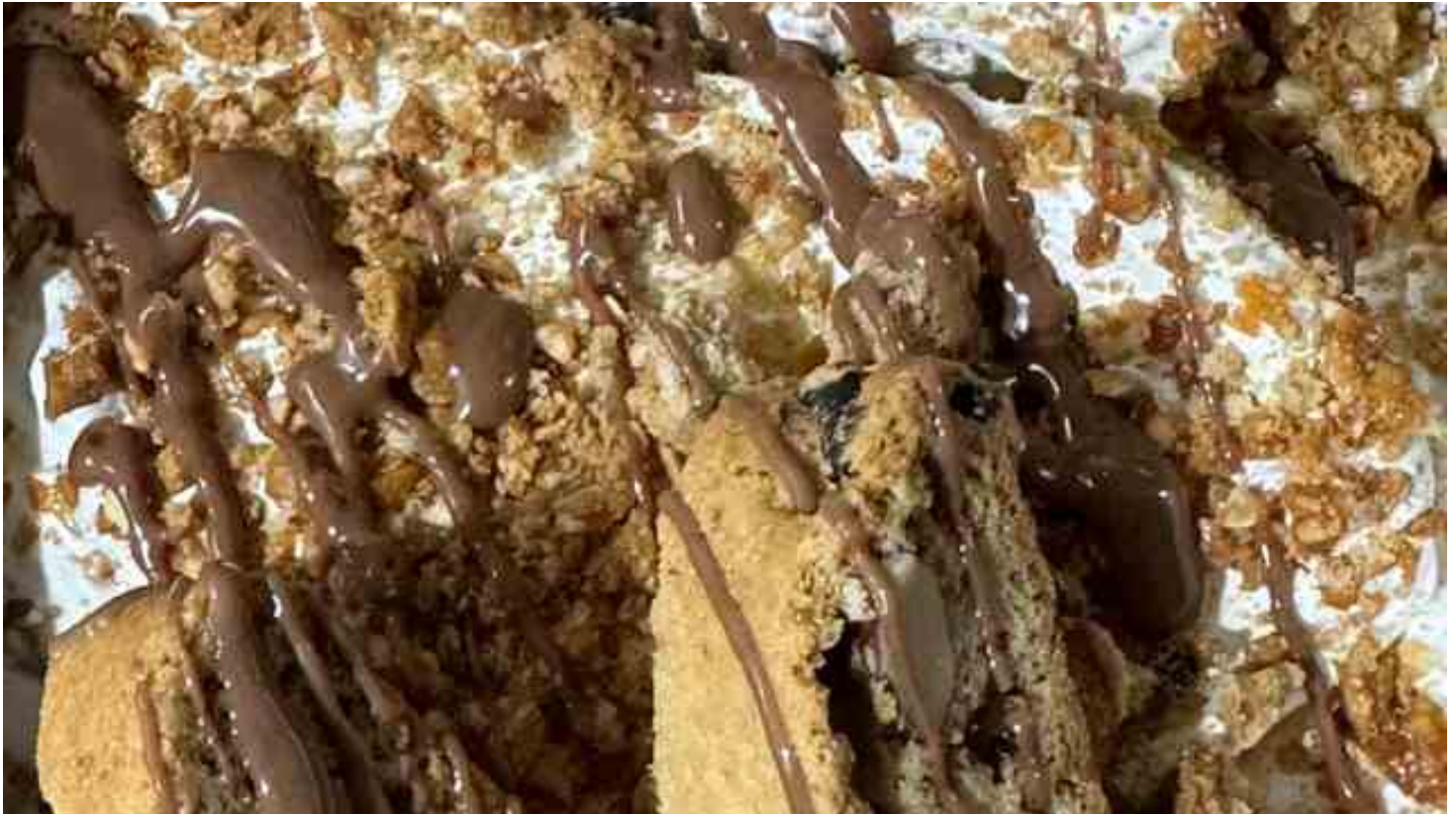
Il gusto "Sua eccellenza Michele" creato dallo staff di Defriscu

L ECCE - Sabato 23 marzo riaprirà al pubblico "Defriscu", la gelateria sociale di Lecce che mette all'opera donne e uomini impegnati in una forma di riscatto sociale dopo aver conosciuto l'emarginazione e la fragilità. Inaugurata a giugno del 2020, ha preso vita attraverso la fondazione di Comunità del Salento ed il suo progetto "Ripartenze". Il laboratorio è situato in via Palmieri 69.