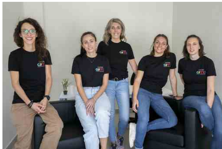
A Cascina Oremo un convegno sulla gestione dei comportamenti disfunzionali