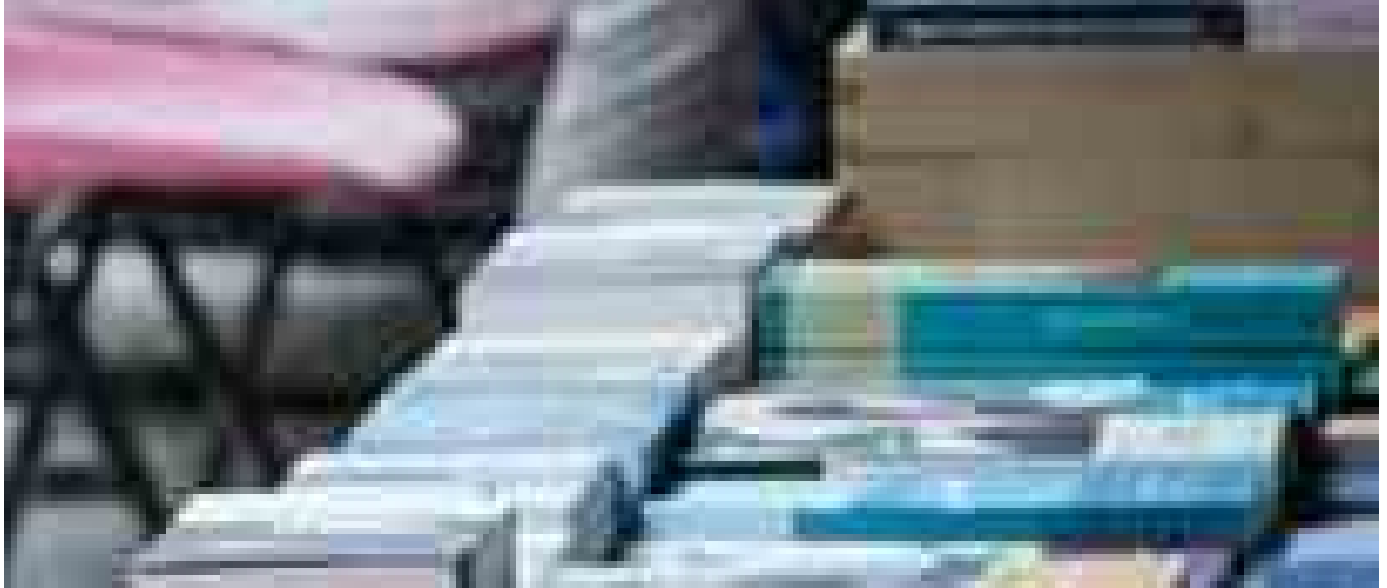
Taurianova è la Capitale Italiana del Libro 2024