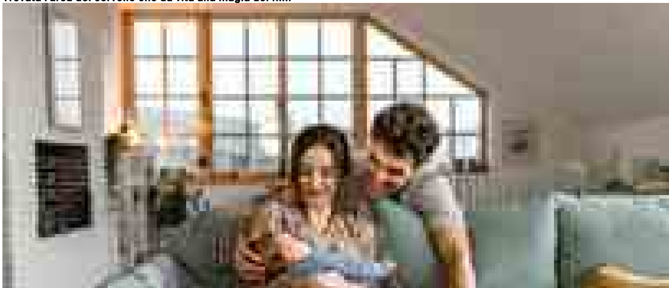
Genitori green, come vivere a impatto (quasi) zero con un bebè