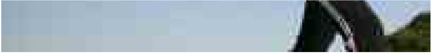
L'attività fisica può ridurre il dolore in chi ha avuto un tumore