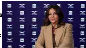
▶ Tv, Sabrina Ferilli torna in Rai con la fiction "Gloria"