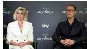
▶ Accorsi e Ramazzotti, un amore che resiste a tempo e distanza