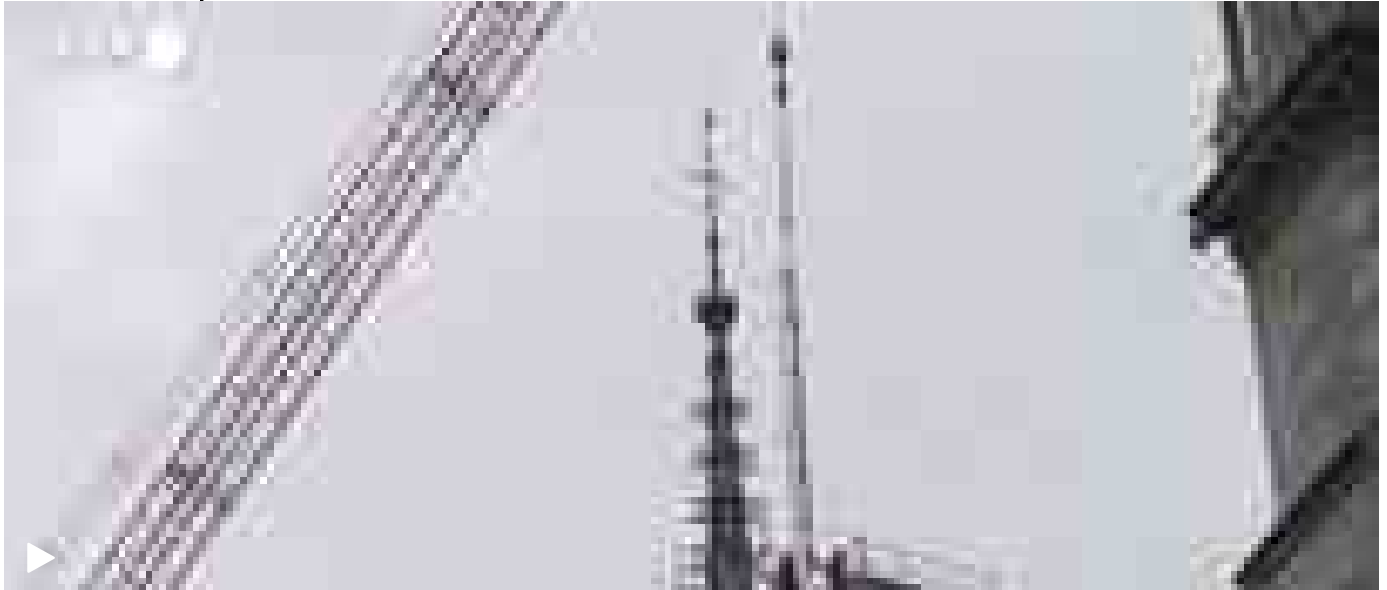
Al via la rimozione delle impalcature da Notre-Dame de Paris

Temi caldi Sanremo Israele Meloni Crosetto Ferrari SF-24