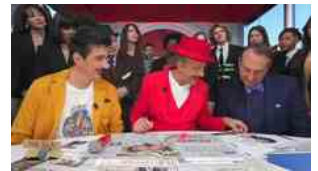
▶ Quando Amadeus e Fiorello chiedevano il pass per Sanremo. Clip "VIVA RAI2!"