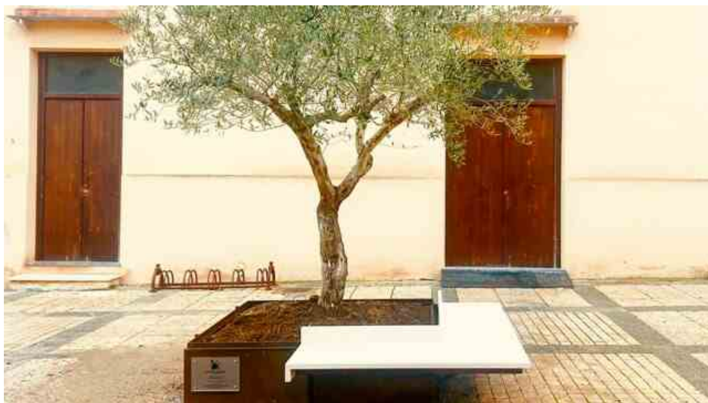
La panchina della solidarietà di Menfi

È stata inaugurata, in piazza Vittorio Emanuele di Menfi, una panchina della solidarietà, che ha l'obiettivo di sensibilizzare la collettività nei confronti del problema della povertà educativa minorile. A volere la panchina sono stati gli stessi ragazzi ospiti della comunità alloggio per minori gestita dalla coop "Walden" di Menfi che, anche attraverso una casa di accoglienza, assiste in totale una quarantina tra minori e donne vittime di abusi o violenze. Persone periodicamente assegnate alla responsabilità dell'istituto dai tribunali ordinari e da quelli minorili.