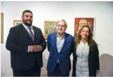
Con Vittorio Sgarbi

Sono state 6 le rassegne che hanno calcato il palco del teatro Lauro Rossi nel 2023: la stagione di prosa promossa con AMAT, la stagione concertistica classica di Appassionata, la rassegna musicale jazz in collaborazione con Musicamdo, la Rassegna d'Arte Drammatica Premio "Angelo Perugini" promossa con l'Associazione Teatro Oreste Calabresi, la stagione sinfonica in collaborazione con la FORM e la Rassegna Nuova Musica (che ha interessato anche la Sala Cesanelli). Sei