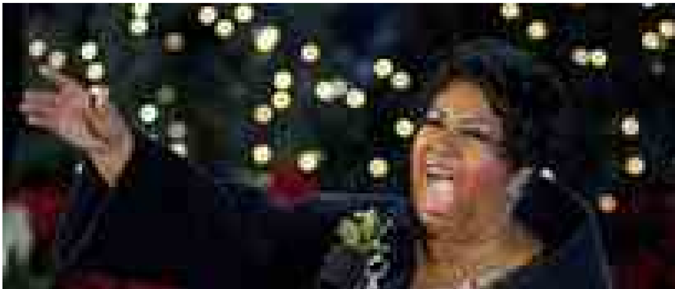
Il testamento di Aretha Franklin trovato in un divano è legale