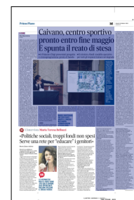
Peso: 1-7%, 9-65%

I numeri dell'operazione sono in effetti notevoli, si conta di realizzare strutture per ben 41 discipline sportive, dal padel all'arrampicata, dalla scherma alle arti marziali. Ovviamente con percorsi aperti a tutti, disabili e anziani compresi. Il governo ci mette quasi 10 milioni per lavori che saranno assegnati con un bando e avviati entro il primo dicembre per essere consegnati il 31 maggio, è stato detto ieri. Poi si tratterà di gestire tutto in modo economicamente sostenibile: è la sfida più difficile, quella che i precedenti affidatari privati hanno perso. Confermata l'intenzione di assegnare il Delphinia ai "polmoni" sportivi delle forze dell'ordine, è stato spiegato che le attività saranno gratuite solo per gli studenti delle quattro scuole della zona. Grande attenzione al green: nascerà una "comunità energetica", ha spiegato il commissario Ciciliano, grazie a pannelli fotovoltaici che renderanno autonomi il Delphinia e anche gli alloggi di 35 famiglie. «Non uno Stato paternalista che cala interventi dall'alto, tutto funzionerà se funzionerà il