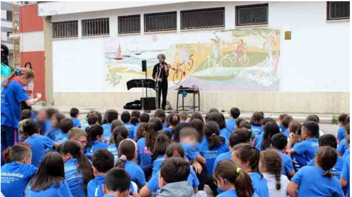
Una delle iniziative della Compagnia Areté Ensemble