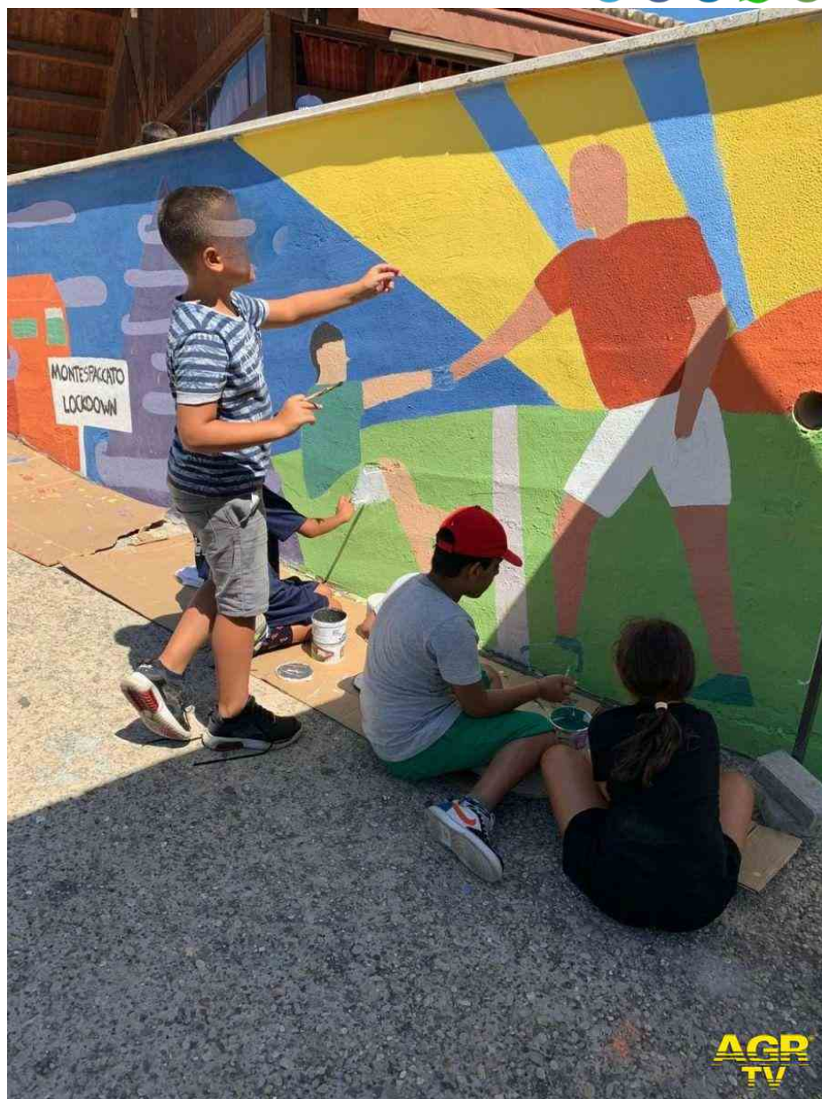
Montespaccato lavori in corso contrasto povertà educativa