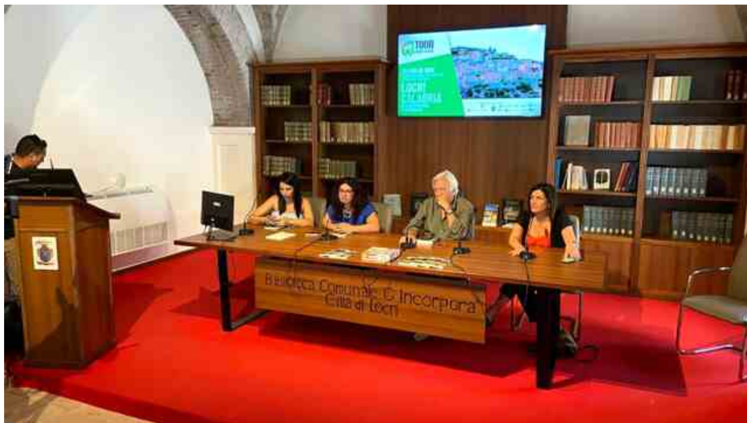
La presentazione del progetto a Locri

E ducazione al cibo sane e le buone abitudini alimentari rivolta ai più giovani come se fosse un gioco. E' l'obiettivo di "Dammi il 5!", campagna di sensibilizzazione nell'ambito del "Tour dei 5 colori", progetto ideato dall'associazione Pancrazio in collaborazione con Società Italiana di Pediatria, Ospedale Pediatrico Bambino Gesù, e giunto a Locri grazie al sostegno di Gal Terre Locridee, Regione Calabria, Unical, città di Locri. Il progetto prevede una serie animata, un libro e tanti gadget attorno ai cinque colori della frutta e delle verdure – verde, bianco, viola, rosso, arancione – che fanno bene e che tutti, bambini e adulti e dovremmo imparare a introdurre di più nella nostra alimentazione, seguendo la dieta mediterranea, vero patrimonio per la salute.