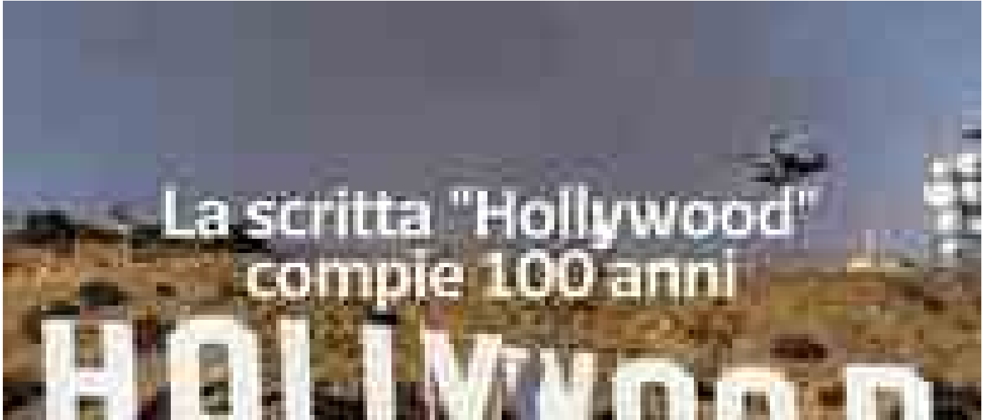
▶ La scritta "Hollywood" compie 100 anni