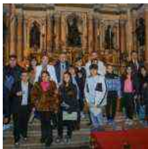
Cappella del Tesoro di San Gennaro: premiati gli studenti dell'Istituto A. Ristori