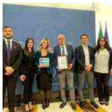
Napoli 'Città Italiana dei Giovani': il Comune dedica il premio a Sbrescia