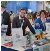
Vico Equense alla BMT, Borsa Mediterranea del Turismo di Napoli