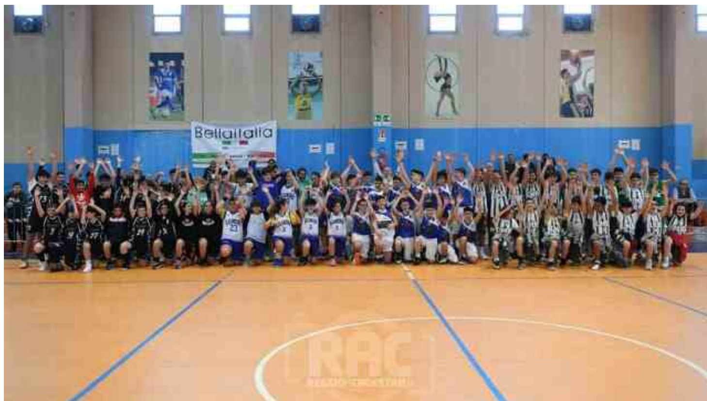
Atleti in campo

I n occasione della Giornata della memoria e dell'impegno in ricordo delle vittime innocenti di mafia, Libera e Csi di Reggio Calabria, hanno promosso un'intensa, partecipata e significativa settimana di sport, giochi, incontri e laboratori educativi.