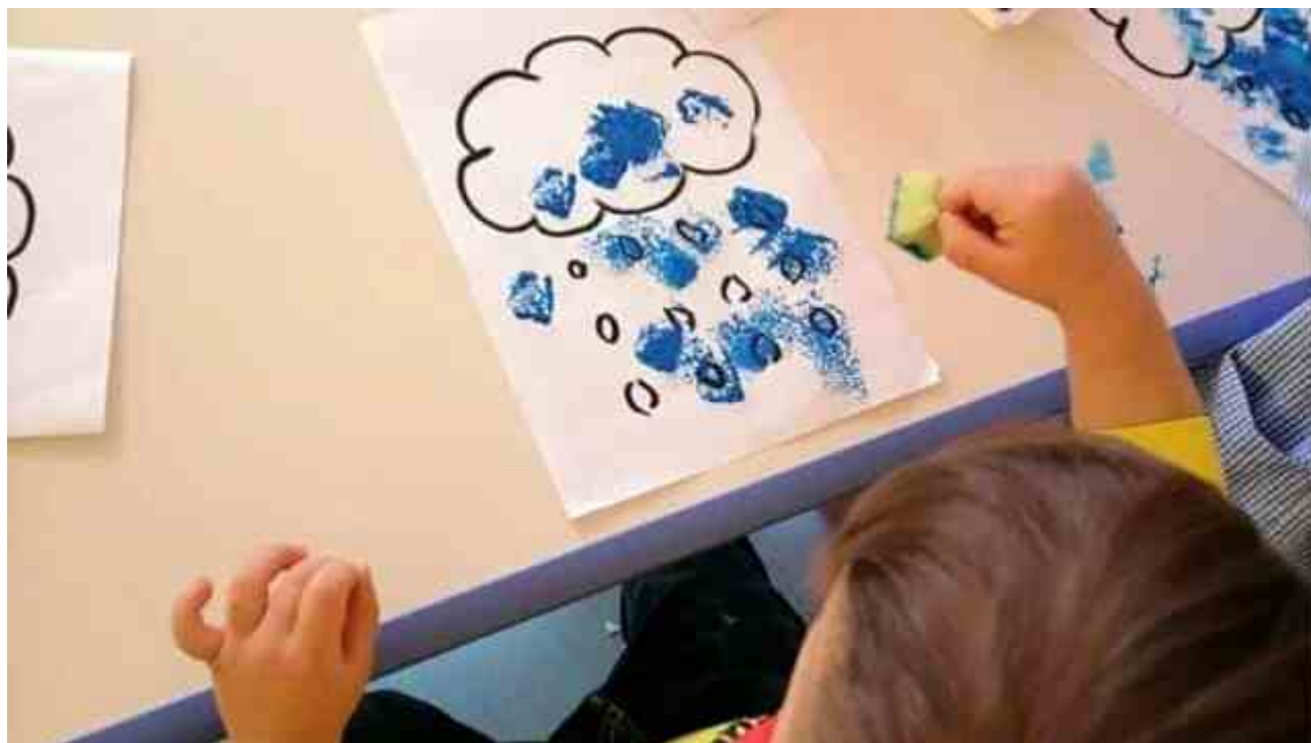
Un bambino durante le attività

E' stato intitolato "Il Buon Inizio" il progetto avviato nella Locride di cui è partner implementatore territoriale l'associazione Civitas Solis di Locri, che ha come obiettivo la creazione di aree ad alte densità educativa attraverso l'attivazione di servizi differenziati per utenti di due fasce distinte di età, 0-36 mesi e 0-6 anni. Appunto un buon modo di iniziare sin da piccolissimi a far parte di una società inclusiva che anche in contesti con criticità stimoli la crescita e permetta di fruire di iniziative, supporto e proposte formative di qualità.