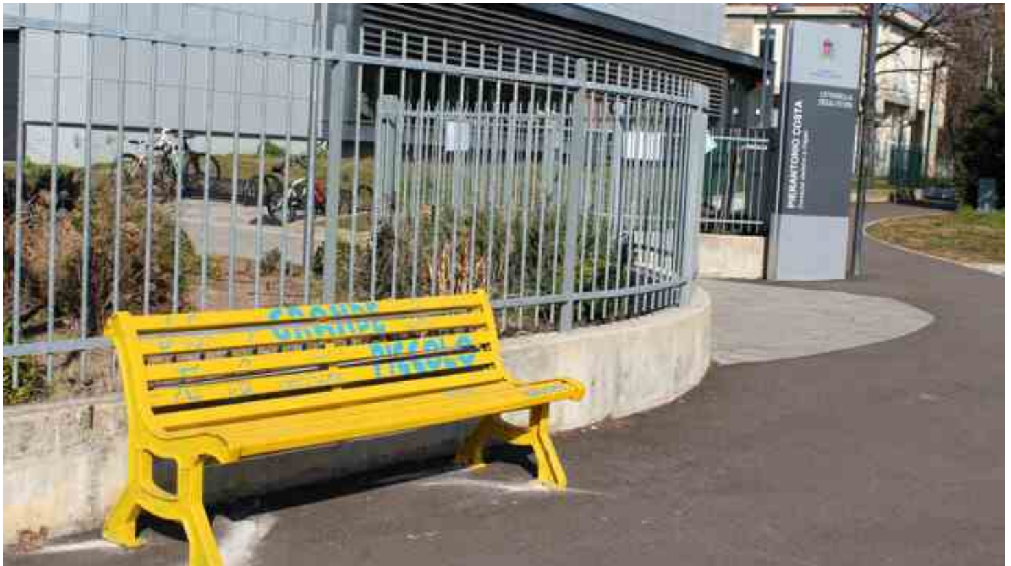
La panchina gialla

S top al bullismo e al cyberbullismo! Una netta condanna ai comportamenti prevaricatori nei confronti dei più giovani viene dagli studenti delle classi terze della scuola secondaria di primo grado di Montebello Vicentino, che mercoledì mattina hanno partecipato ad una serie di attività di formazione e sensibilizzazione, organizzate dall'Istituto Comprensivo in collaborazione con le Cooperative Tangram e Insieme in occasione della Giornata mondiale contro il Bullismo e il Cyberbullismo, celebrata il 7 febbraio.