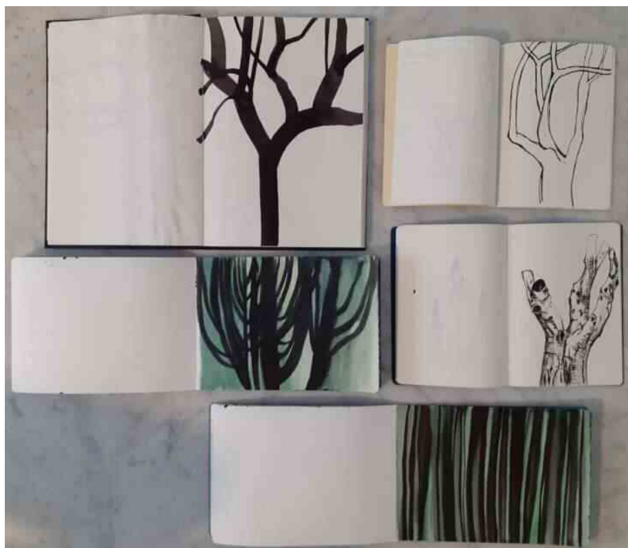
DiSegni Vegetali-Maria Rocca