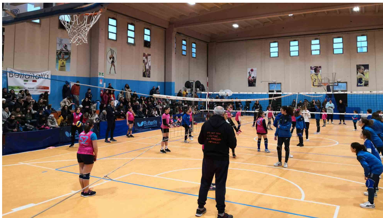
Il gruppo della pallavolo

Reggio Calabria ha presentato l'attività che ha coniugato tornei sportivi, giochi e laboratori educativi all'interno dello spogliatoio.