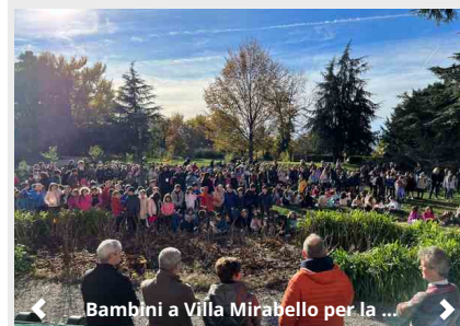
Bambini a Villa Mirabello per la ...