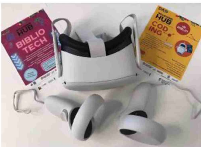
Tra le new entry della raccolta civica c'è anche la realtà virtuale

L'hub tecnologico che sta per entrare in funzione a Lumezzane affianca quelli già creati (in Valtrompia) a Concesio e Gardone nell'ambito del progetto «Differenti approcci didattici» sostenuto dall'impresa sociale «Con i bambini», dalla Fondazione Cariplo e dalla Fondazione della Comunità bresciana. ●