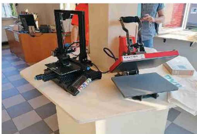
La dotazione. Stampanti tridimensionali e presse nel laboratorio