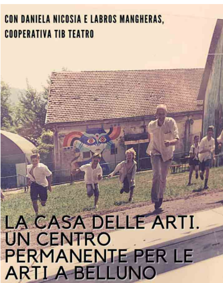
Casa delle Arti

educativa minorile), che offrirà a bambini e famiglie sei spettacoli di teatro ragazzi ad ingresso gratuito, sei spettacoli all'insegna dell'amicizia e della condivisione, in due spazi resi vivi proprio grazie all'incontro, alla socializzazione, alla partecipazione.