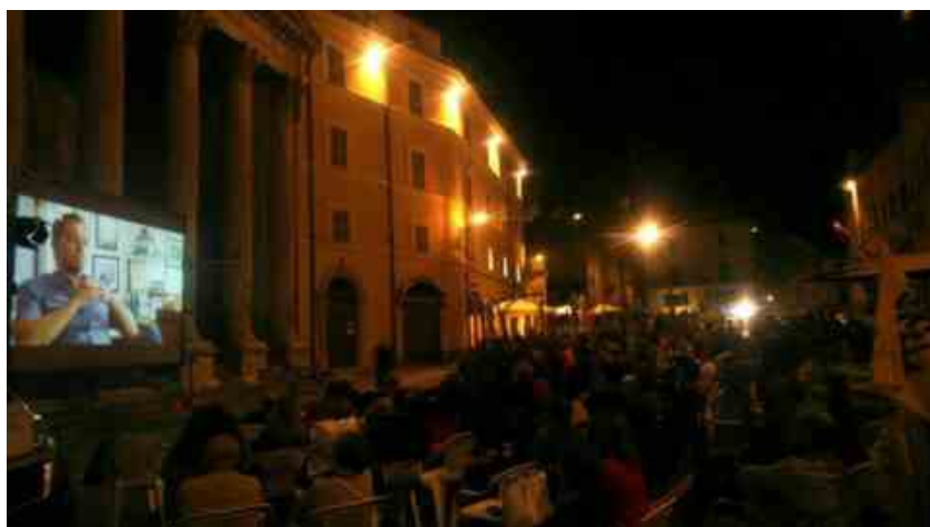
Libero Cinema in Libera Terra