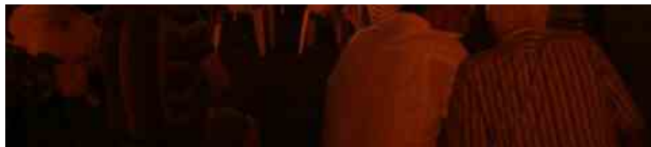
Libero Cinema in Libera Terra