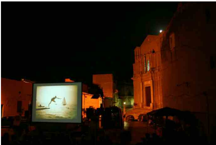
Festival Libero Cinema in Libera Terra

CINEMOVEL È LA PIÙ ANTICA ISTITUZIONE DI CINEMA ITINERANTE IN ITALIA. FINO AL 16 OTTOBRE 2022 SI TIENE LA 17ESIMA EDIZIONE DI LIBERO CINEMA IN LIBERA TERRA PROMOSSA DA CINEMOVEL FOUNDATION E LIBERA. RIPERCORRIAMO LA SUA STORIA