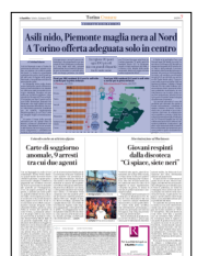
Peso: 1-5%, 7-43%