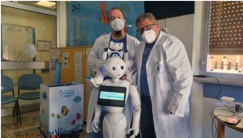
Il robot Sally al Salesi di Ancona

ANCONA – All'ospedale Salesi di Ancona cresce e si potenzia la robot terapia impiegata sui piccoli pazienti ricoverati al pediatrico. La Fondazione Ospedale Salesi onlus sta ultimando la fase di programmazione di Sally , un nuovo robot umanoide che, in collaborazione con l'equipe medica e paramedica e gli operatori della Fondazione, impiega l'intelligenza artificiale per adattarsi alle reazioni emotive dei bambini nei momenti complessi del loro ricovero. I