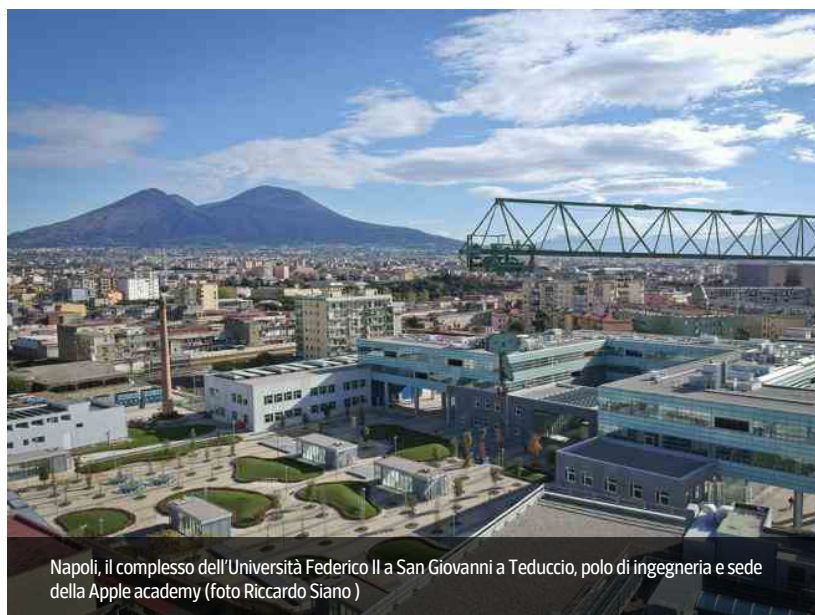
Napoli, il complesso dell'Università Federico II a San Giovanni a Teduccio, polo di ingegneria e sede della Apple academy

Iniziative, imprese, nuove forme di alleanza fra mondo profit e no profit. Tentativi di costruire nuovi tessuti sociali, mettendo in moto processi di trasformazione. Perché, scriveva Nitti, «l'equivoco presente continuerà fino a quando noi attenderemo la nostra salvezza dagli altri e non da noi stessi»