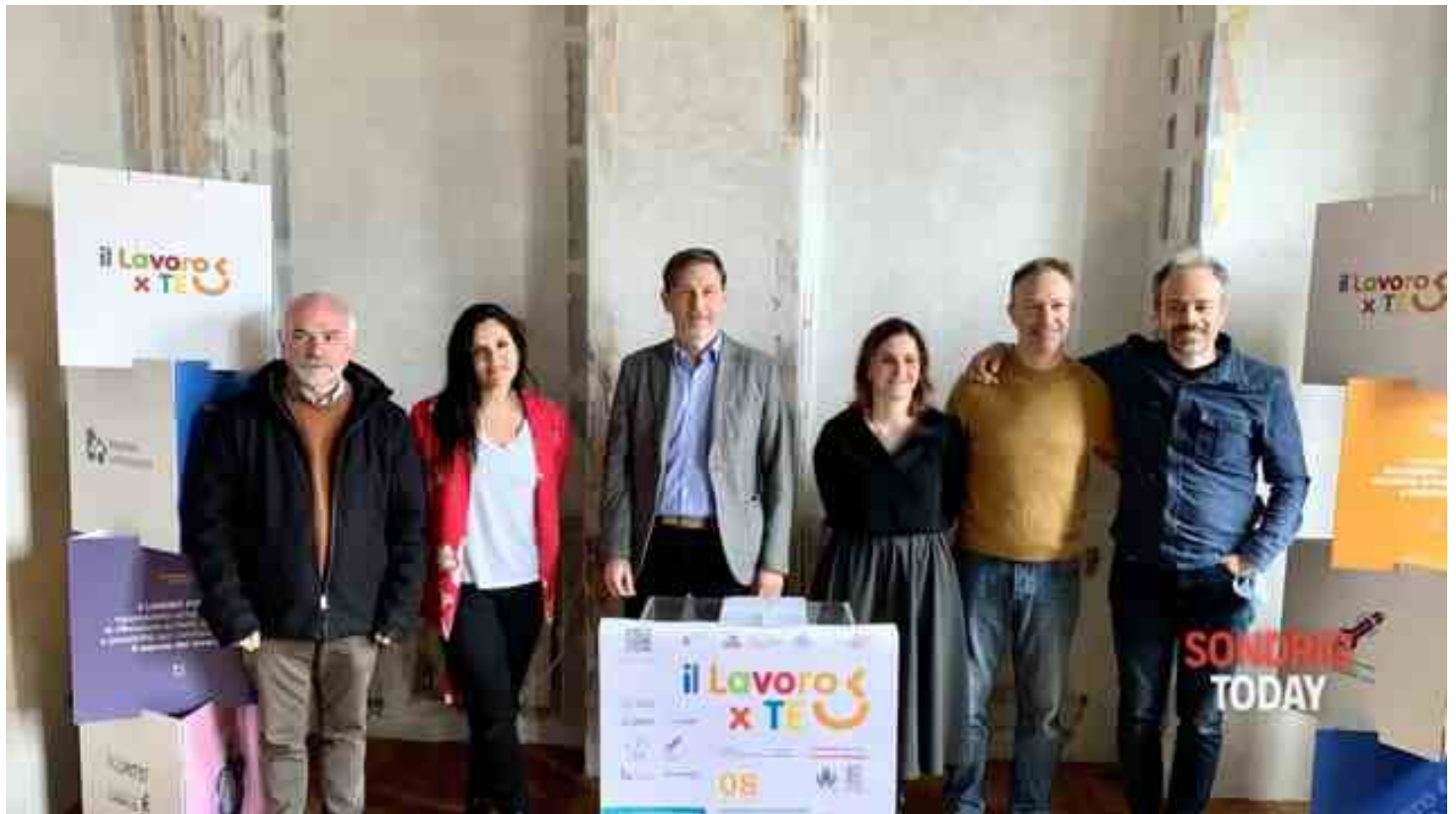
I promotori dell'iniziativa