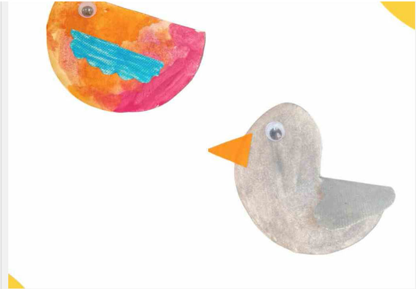
Cimmi e Cipi, dal progetto della Scuola dell'infanzia "San Giuseppe" di Masi (PD)

Nei disegni dei bambini della scuola dell'infanzia "San Giuseppe" di Masi (Pd) , Cipi incontra un piccione, Cimmi, che abita già nel giardino della scuola: ci sarà posto per tutti e due? Nella scuola dell'infanzia "Pietro Selmi" a Polesella (Rovigo) , l'uccellino di Mario Lodi ha invece incontrato personaggi fiabeschi, mentre i bambini della 1 a C della scuola primaria "De Amicis" di Treviso hanno immaginato un'avventura per i figli di Cipi, raccontata con disegni e voce.