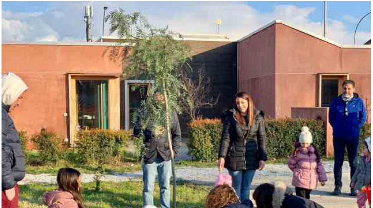
Progetto “Ip Ip Urrà – Infanzia Prima” Messina

A nche Messina protagonista delle iniziative promosse dalla rete del progetto “Ip Ip Urrà – Infanzia Prima”, selezionato dal fondo di contrasto alla povertà minorile dell'impresa sociale Con i bambini , che vedono nove città italiane, da Sud a Nord, unite in eventi partecipativi per celebrare una primavera di rinascita e di cammino verso la crescita nei pieni diritti, a partire da quelli della prima infanzia.