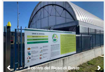
Il centro del Riuso di Busto