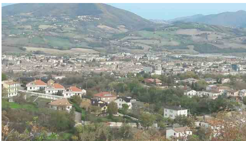
Una veduta di Fabriano

FABRIANO – Da oggi e fino al 13 marzo prossimo, il PDP porta online le attività del progetto DOORS con una formazione gratuita per docenti e educatori. Il PDP, l'associazione di Fabriano che dal 2003 promuove il software libero sul territorio, propone un ciclo formativo, rivolto a docenti ed educatori, nell'ambito di DOORS – Porte Aperte al Desiderio come OppOrtunità di Rigenerazione Sociale, il progetto selezionato dall'Impresa sociale Con i Bambini nell'ambito del Fondo per il contrasto della povertà educativa minorile. In tutto 25 ore di formazione gratuita in cui verrà trattato l'approccio LCL sviluppato dal MIT di Boston, per favorire e coltivare la creatività nell'apprendimento.