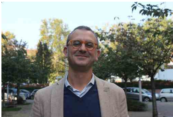
Gli interventi della città di Torino a sostegno delle pari opportunità