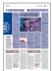
Peso: 1-8%, 3-49%