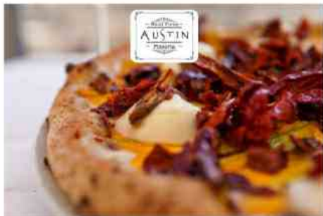
La pizza dell'antico forno di Sant'Agostino