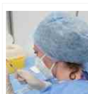
Buona la prima Covid, salgono i