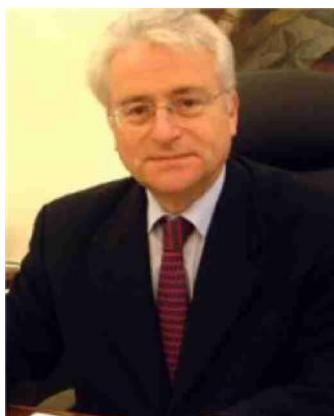
DOCUMENTO DI PROGRAMMAZIONE ANNUALE 2022 LA RIPARTIZIONE DELLE RISORSE PER OBIETTIVI STRATEGICI