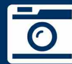
IMMAGINE NON DISPONIBILE

Porzione di fabbricato in costruzione - 60000