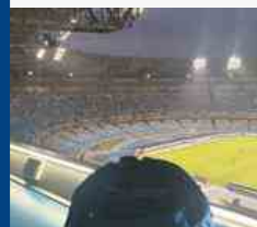
NAPOLI- SPARTAK, FOCUS DAL MARADONA