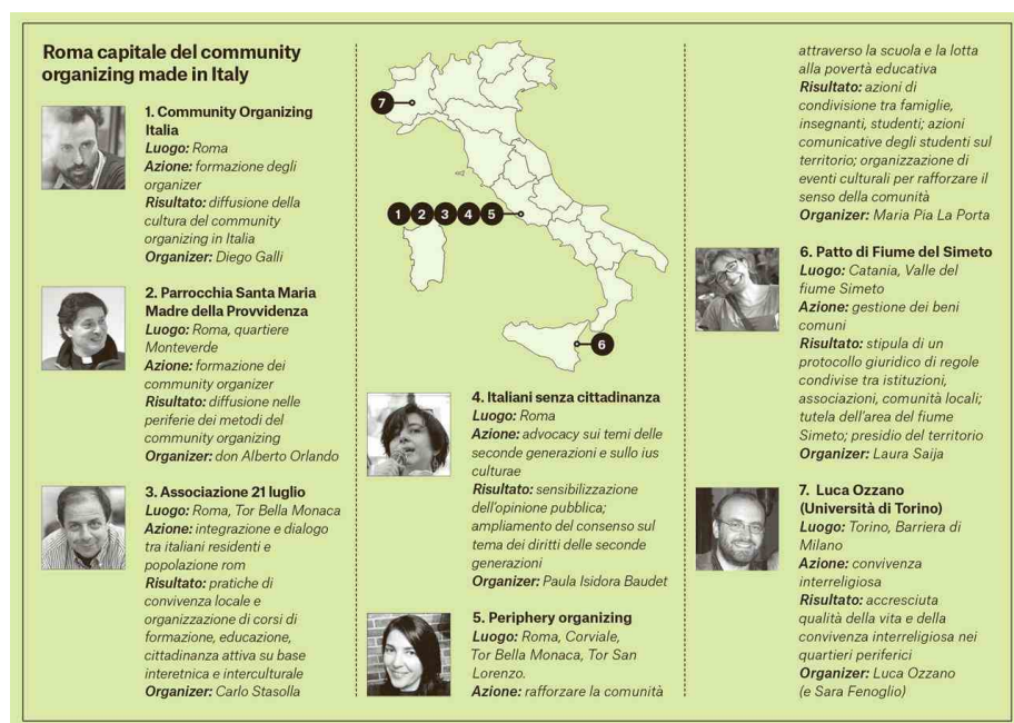
La mappa dei community organizer in Italia

Community Organizing Italia ha sede a Roma e Torino, è affiliata all'Industrial Areas Foundation, rete internazionale tra le più consolidate e riconosciute in questo ambito, ed è il vero epicentro delle iniziative di formazione per i nuovi organizzatori di comunità che si stanno diffondendo dalla Capitale al resto del Paese. Roma, infatti, si sta rivelando un terreno fertile per questo tipo di approccio.