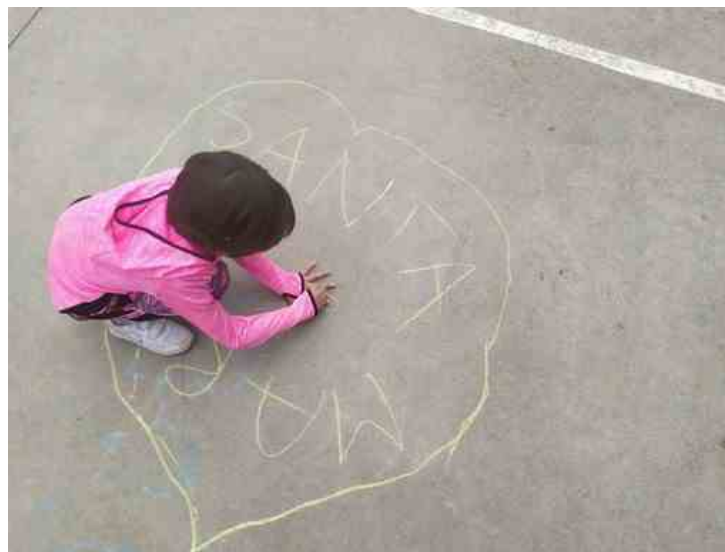
Pausa per le attività di Storie cucite a mano

L'appuntamento è fissato per il 4 settembre