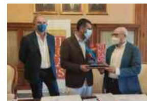
Premio Nikolaos dello Sport città di Bari: presentata la sesta edizione del riconoscimento riservato agli sportivi