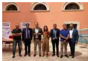
A Bari i nuovi corsi Its di Informatica progettati dalle aziende