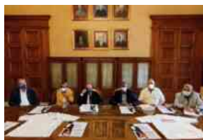
Bari, giornata straordinaria di donazione del sangue promossa dall'Ordine degli avvocati e dalla Fratres